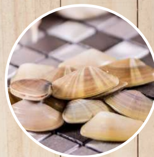
COQUINA Donax trunculus Mittelmeer-Dreieckmuschel/ Hapricot de mer/ Tellina/ Cadelinha/ Wedge clam/ Fujinohanagai