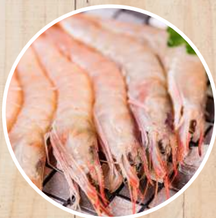
GAMBA Parapenaeus longirostris Spanish red shrimp/ Rosa Geisselgarnele/ Crevette tropicale profonde/ Gambero rosa/ Camarão da costa / Tsunonagasaki-ebi