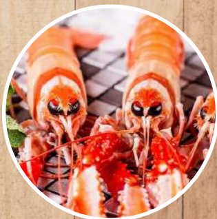
CIGALA Nephrops norvegicus Scampi/Tiefseehummer/ Langoustine/Scampo/ Lagostim/Akazaebi