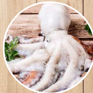
PULPO Octopus vulgaris Octopus/ Gewöhnlicher Krake/ Poulpe/ Polpo di scoglio/ Polvo/ Ma-dako tako