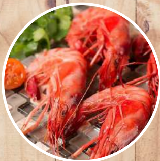
ALISTADO Aristeus varidens Striped red shrimp/ Camarão