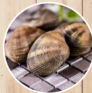
ALMEJA Ruditapes decussatus Grooved carpetshell/Grosse Teppichmuschel/Palourde/ Vongola verace/ Amêijoá boa