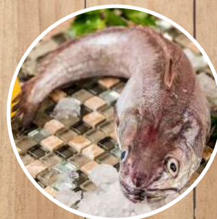
PESCADILLA Merluccius merluccius Hake/ Europäischer Seehecht/ Merlu européen/ Nasello/ Pescada Branca/ Tara-no-ruí